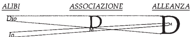
Immagine che illustra il modo con cui comprendo queste tre differenti relazioni con Dio:

È da notare come l'IO diminuisce per simbolizzare che devo accettare di diminuire per avere una relazione più intima con Dio, e diminuire ancora per divenire "Uno" con Lui.